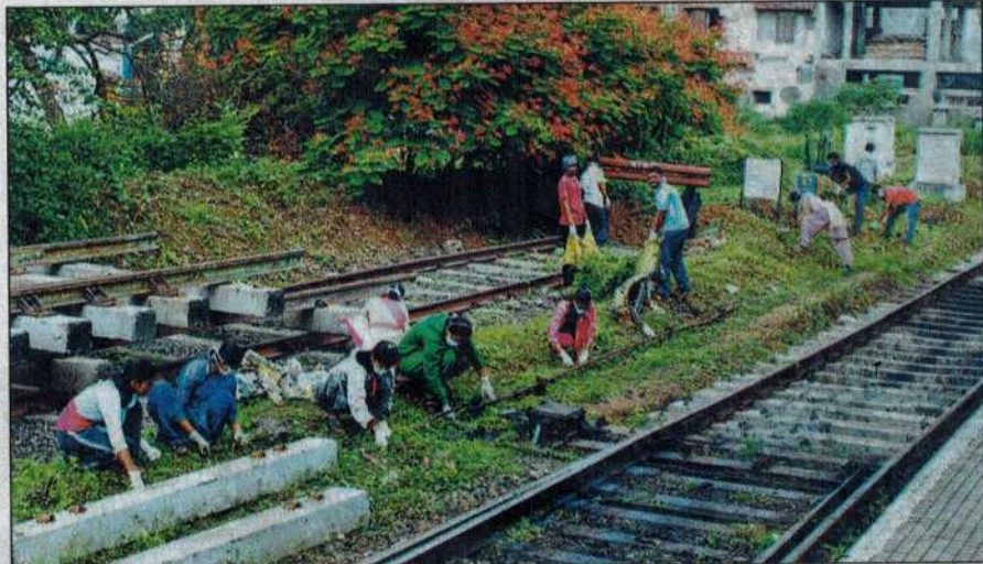
The drive was conducted near the Chhatrapati Shahu Maharaj terminus and other important places

en involved in the cleanliness drive for the past few years now. Their initiative has also increased the participation of citizens along with students and other officials over these years."