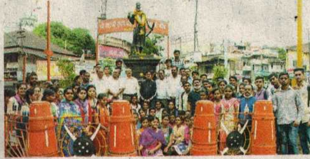
कोल्हापूर : शिवाजी महाराजांच्या पुतळ्यास अभिवादन करताना विद्यार्थी.